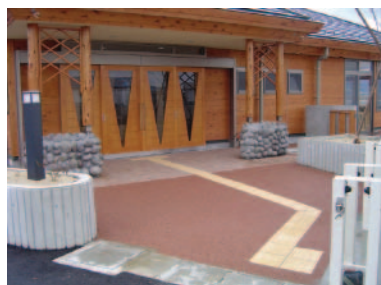
羽咋市千路町地内