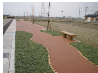
能美市西任田地内