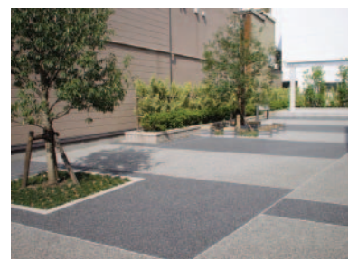
金沢市横安江地内