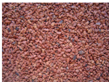
K-グラウンド (R) 表面