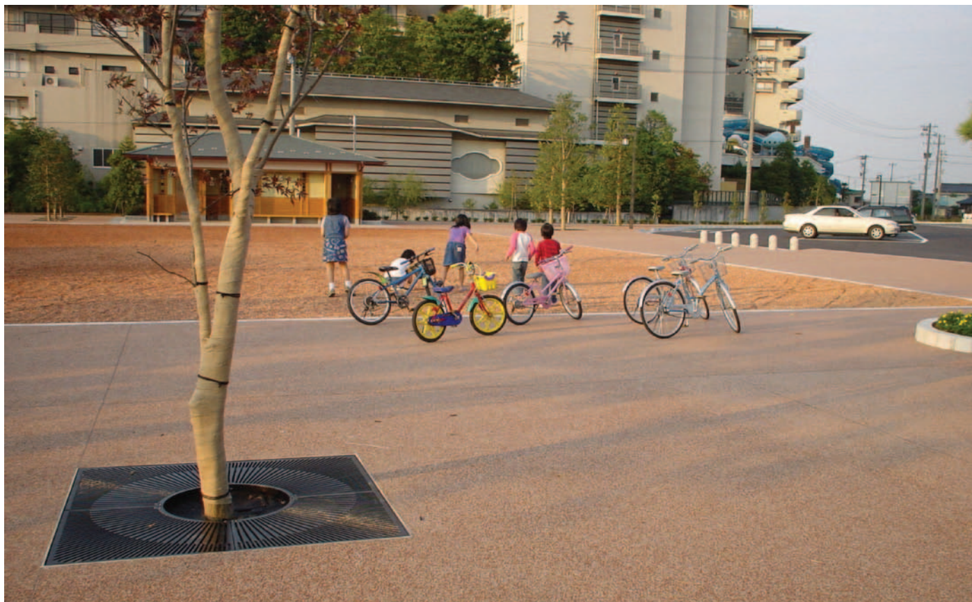
加賀市山代温泉地内

瓦廃材を再利用した樹脂舗装。K-グラウンド (R) は機能性と独特の美しさを兼ね備えています。舗装用骨材として再利用された瓦は、樹脂舗装にすることで透水性に優れ、水溜りの出来ない、そして歩行感がソフトな人と環境に優しいものとなります。またそれはヒートアイランド抑止にもつながり、都市部への適用で効果を発揮します。意匠面では、瓦の持つ釉薬部分が光を乱反射させて輝き、独特の風合いを醸し出します。これは歩行者に対する安全性を高める事にもなります。歩道のほか、住宅の玄関アプローチなどにも合うK-グラウンド (R)。あなたの街へそしてご自宅へ、ぜひご利用ください。