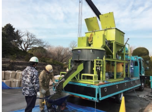
練り合わせた材料は一輪車やショベル等で受けて現場に運搬