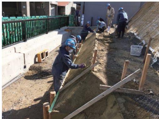
土舗装材の施工状況