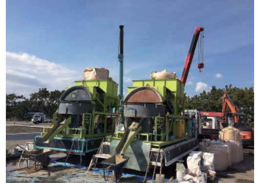
大型の現場は2台プラントを並べて製造