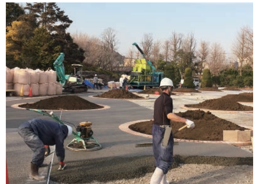
ポーラスコンクリート施工状況