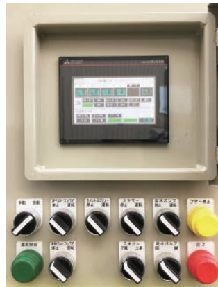
タッチパネル式の配合設定画面と、各種機器の運転スイッチ、ボタン類。