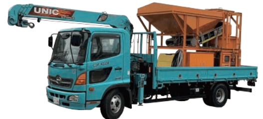
移動式クレーン車に搭載