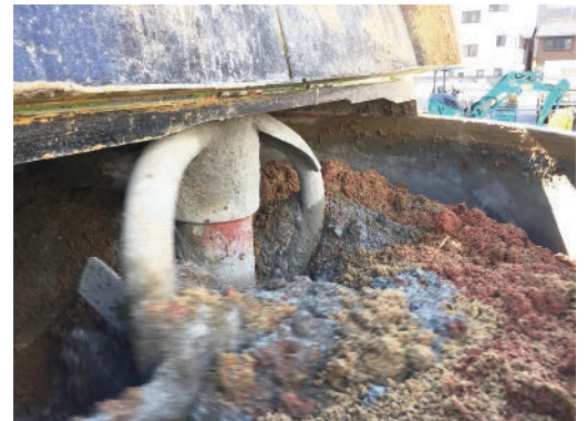
パン型ミキサーで強力に攪拌