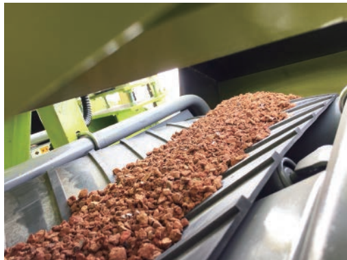
骨材はベルトコンベアで、セメントはスクリーコンベアで移送